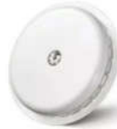
يمكنك استخدام مجس فري ستايل ليبري في 3 خطوات سهلة

١- جهاز فري ستايل ليبري. وهو جهاز دائري صغير، قطره لا يتجاوز ٣ سم تقريباً، صدرت منه ثلاثة إصدارات آخرها برقم (٣) يتميز بصغر حجمه ودقة قراءته وربطه بالجوال أو جهاز خارجي لإعطاء القراءات والتنبيهات في حال الارتفاع أو الانخفاض كما يعطي تقريراً عن مستوى السكر في الدم لمدد طويلة (٢) .